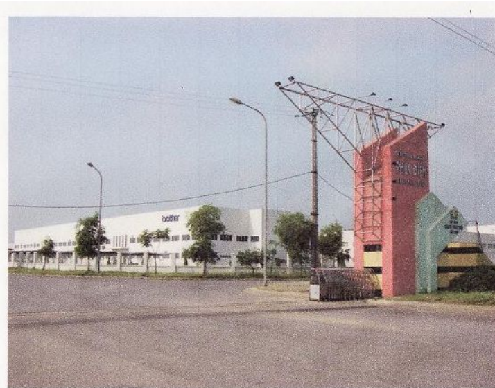
フクディエン工業団地入口付近