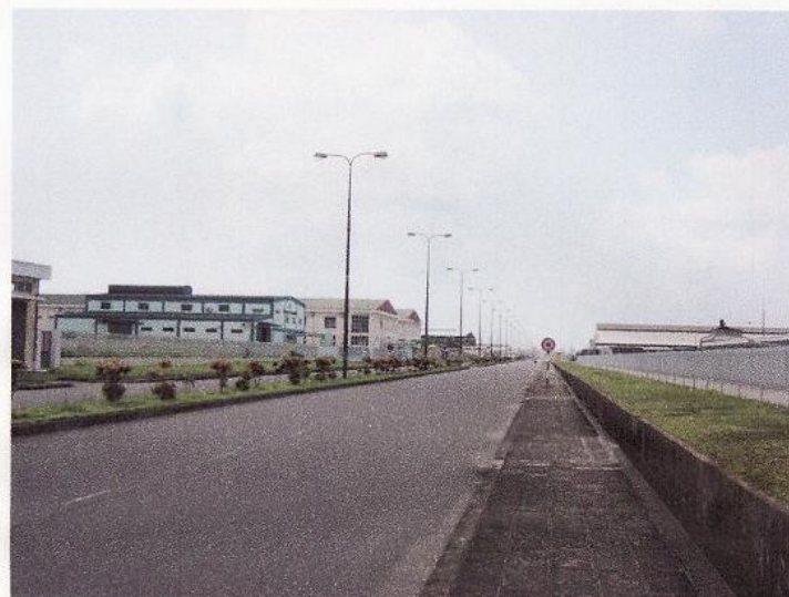
野村ハイフォン工業団地