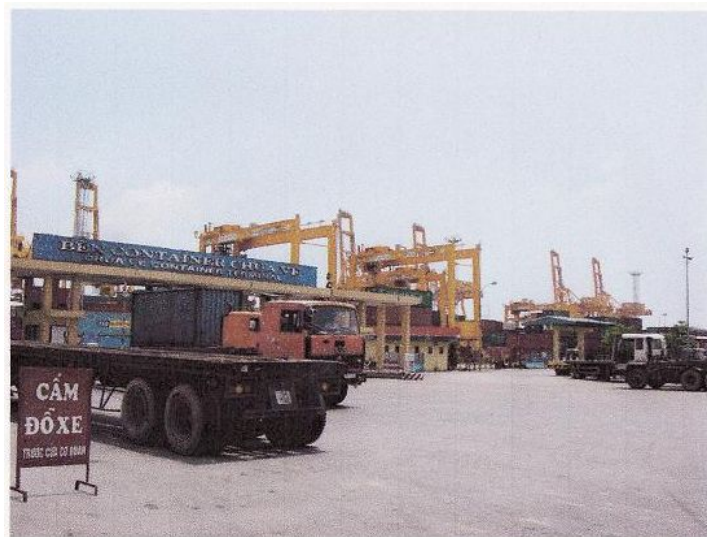
ハイフォンコンテナヤード入口付近