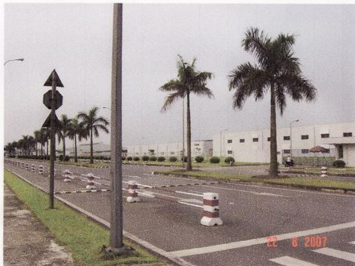
タンロン工業団地