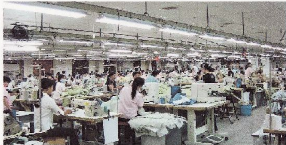
ホーチミン輸出加工区内縫製工場